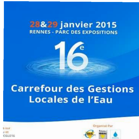
16 ème Carrefour des Gestions locales de l'eau Janvier 2015