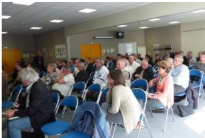
Groupe de travail « partenariat entreprises » avec les Ligues et Comités Régionaux

CREE DU LIEN AVEC LE MONDE DE L'ENTREPRISE