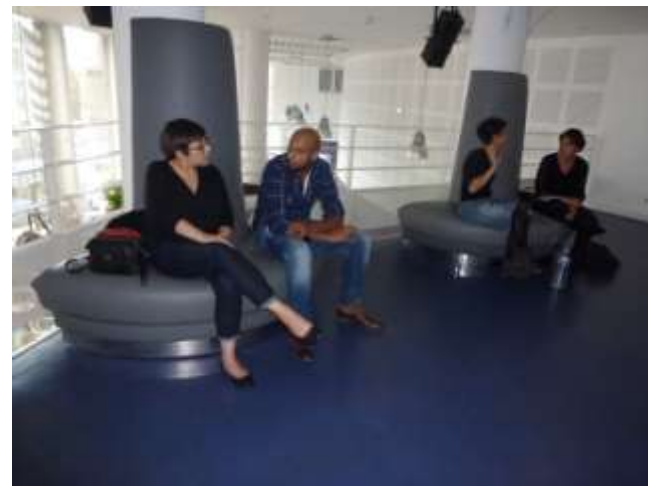
Pitcher pour convaincre (Réso solidaire) Rennes le 9 octobre 2015