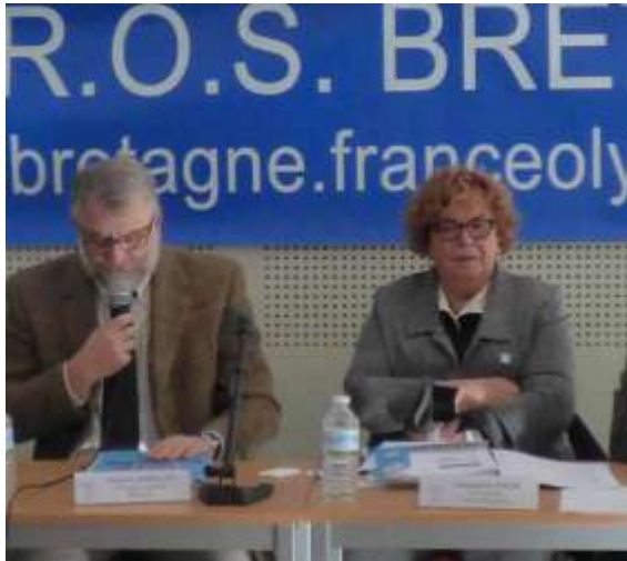
Assemblée générale 2015 Quimper

PARTICIPE A LA COORDINATION DE LA POLITIQUE SPORTIVE REGIONALE