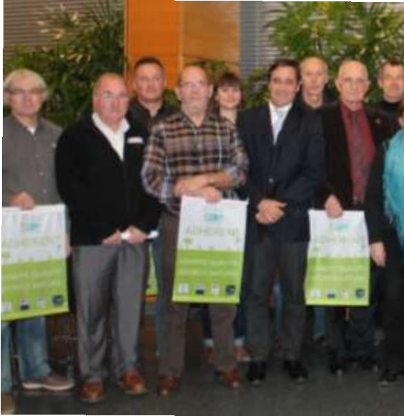
Démarche qualité des manifestations des sports nature