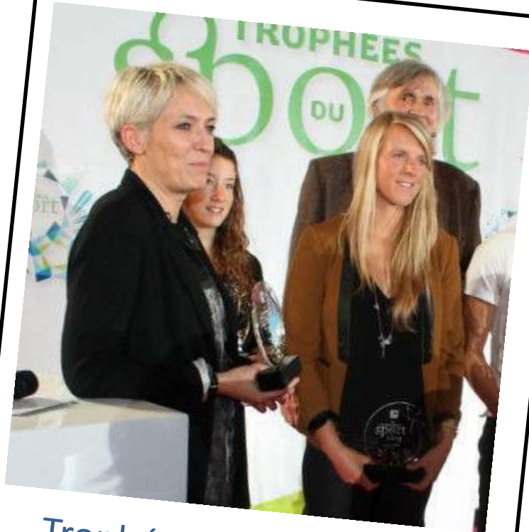
Trophée du sport breton 2015