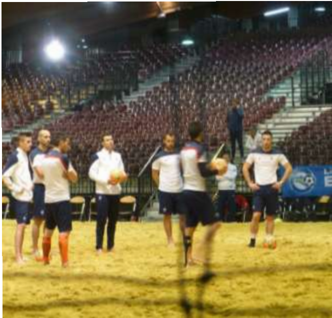
Foire Internationale de Rennes 21>29 mars 2015

VALORISE ET COMMUNIQUE SUR L'ENGAGEMENT DU MOUVEMENT SPORTIF BRETON