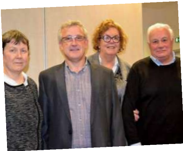
Le Conseil Consultatif Régional (CCR)

PARTICIPE A LA COODINATION DE LA POLITIQUE SPORTIVE REGIONALE