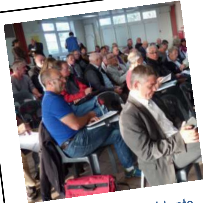
Matinée des Présidents Septembre 2015

Thématiques : "partenariat privé " et " diagnostic haut niveau "