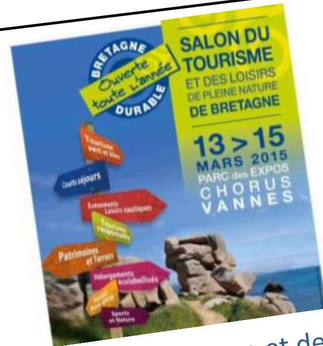
Salon du Tourisme et des loisirs de pleine nature Vannes - Mars 2015