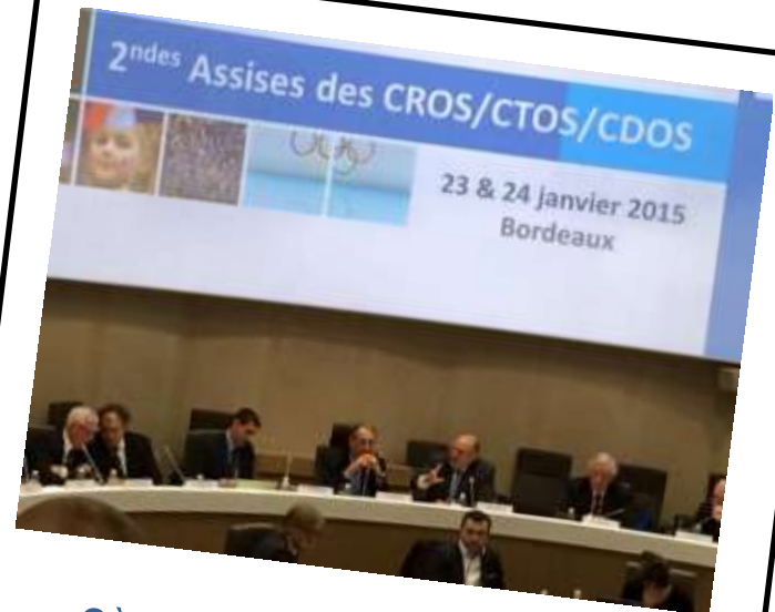
2 èmes Assises nationales CROS – CDOS – CTOS Janvier 2015 - Bordeaux