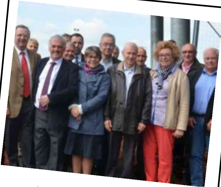
Le Conseil du sport

PARTICIPE A LA COORDINATION DE LA POLITIQUE SPORTIVE REGIONALE