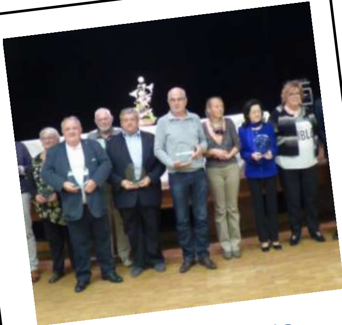
Les Hermines d'Or Octobre 2015