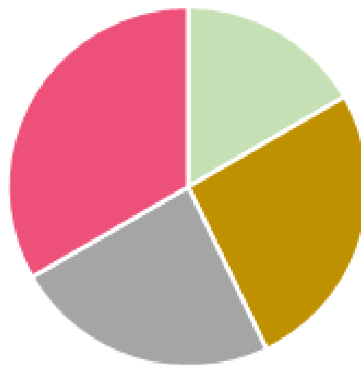
Répartition des participants par département