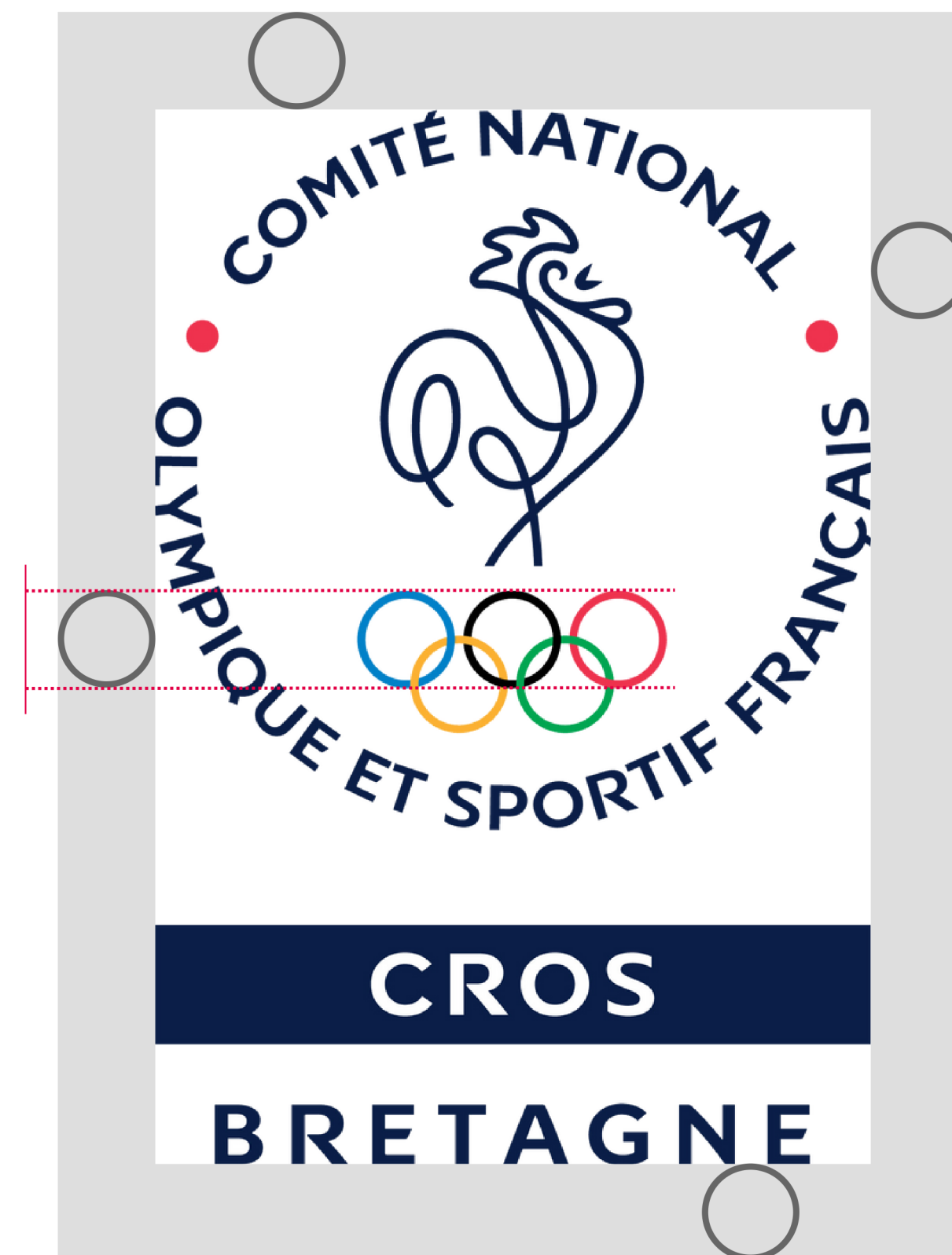
- Zone d'isolation -

Cette zone d'isolation est définie selon la taille des anneaux olympiques du logotype réalisé.